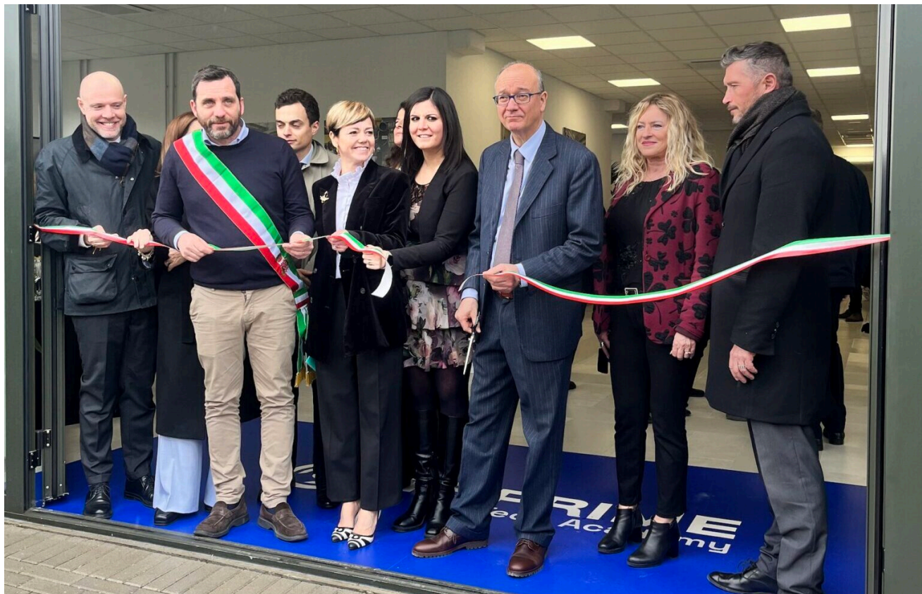
Il taglio del nastro dell’Its Prime a Pistoia

Valditara è intervenuto sulla posizione della Regione Toscana contraria agli accorpamenti fra scuole . “Noi abbiamo offerto tre opportunità importanti – ha detto – alle scuole che dimensionano. Abbiamo offerto la possibilità di avere un vicepresidente vicario, con un docente che viene esonerato dall’attività didattica e quindi sostituisce il preside che prima era reggente e si spostava da una scuola all’altra. Poi abbiamo anche concesso di scendere sotto il numero minimo degli studenti per classe, e abbiamo anche concesso l’invarianza di organico del personale Ata. Sono tre opportunità molto importanti” .